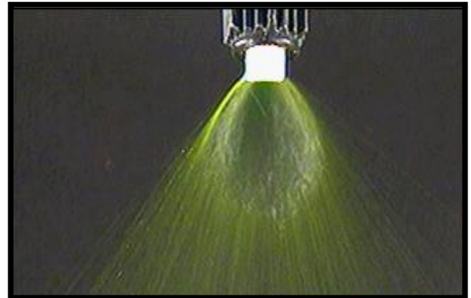
Avec un On Target antidérive

Il importe de bien gérer vos arrosages. L'agriculture de précision signifie moins de marge d'erreur. Par contre, les marges d'erreur peuvent être gérées en suivant le simple processus en trois étapes pour bien gérer les arrosages 1) Bon jugement , 2) Équipement approprié , 3) Utiliser l'adjuvant antidérive ON TARGET . Les professionnels de l'arrosage qui ont du succès aujourd'hui suivent ces trois étapes chaque fois qu'ils arrosent.